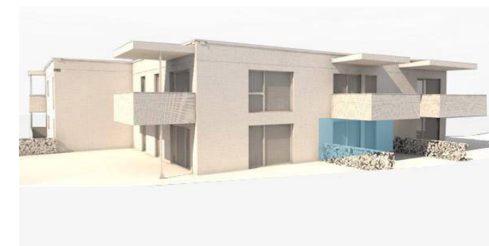
lage im gebäude